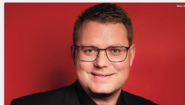
Bundesländer zusammenlegen, um Geld beim Länderfinanzausgleich zu sparen: Der Vorschlag kam in diesen Tagen von Bayerns Ministerpräsident Markus Söder bei der Winterkonferenz der CSU auf Kloster-Bain. Die Reaktionen lassen nicht auf sich warten.

Radio Euroherz, Plassenburg u.a. – 14.01.26 „Reaktion auf Söders Idee: Bundesländer zusammenlegen "schlechter Stil", meint Griefshammer (SPD)“