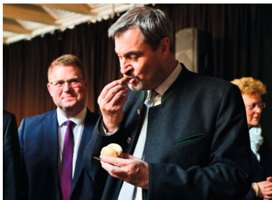
Söder und die Wurst: Nach seiner Ankunft bei der diesjährigen Premiere der Luisenburg Festspiele wird der Ministerpräsident standesgemäß empfangen.

Nordbayerischer Kurier u.a. – 27.12.25 „Jeden Tag eine neue Herausforderung“