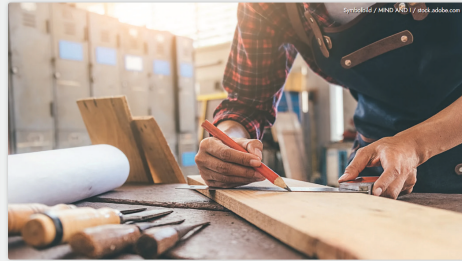
Aus der Wirtschaft kommt gerade viel Kritik an der von der Bundesregierung geplanten steuerfreien Pläne von bis zu 1.000 Euro. Viele mittelständische Unternehmen und Handwerksbetriebe können sich das nicht leisten.

Radio Euroherz – 17.04.2026 „Handwerksfonds abgelehnt: SPD-Fraktionschef Griebhammer enttäuscht“