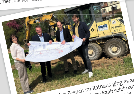
Im Anschluss an den Besuch im Rathaus ging es an das Flussbett der Wiesent. Die Firma Raab setzt nach langer Planung nun ihr Service-Wohnen-Projekt in die Tat um - es entstehen Tiny-Häuser und ein Wohn-campus unter dem Motto „Gemeinsam statt einsam“.