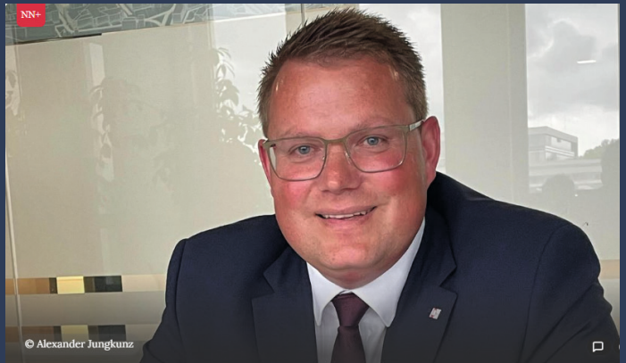
Interview zur Koalition

Frankfurter Rundschau – 28.04.26 „Geschmäcke bleibt: Gipfel-Treffen am Tegernsee startet ohne Spitzenpolitik“