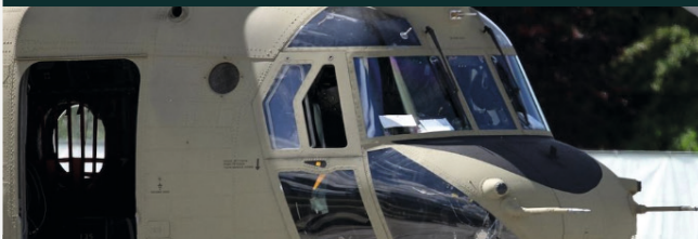
SPD fordert mehr Einsatz gegen US-Truppenabzug - (Foto: Hubschrauber der US-Army (Archiv)) über dts Nachrichtenagentur

08. Mai 2026 - 14:40 Uhr Von Peter Heidenreich - Deutschland