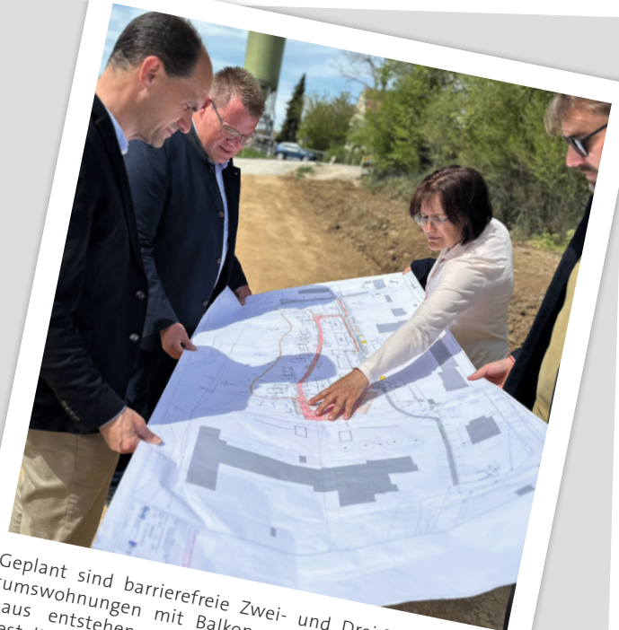
Geplant sind barrierefreie Zwei- und Drei-Zimmer-Eigentumswohnungen mit Balkon oder Terrasse. Darüber hinaus entstehen erstmals architektonisch ansprechend gestaltete Tiny-Häuser auf eigenem Grundstück. Jedes Haus bietet einen schönen Blick ins Grüne und verbindet modernes, durchdachtes Wohnen mit Naturnähe.