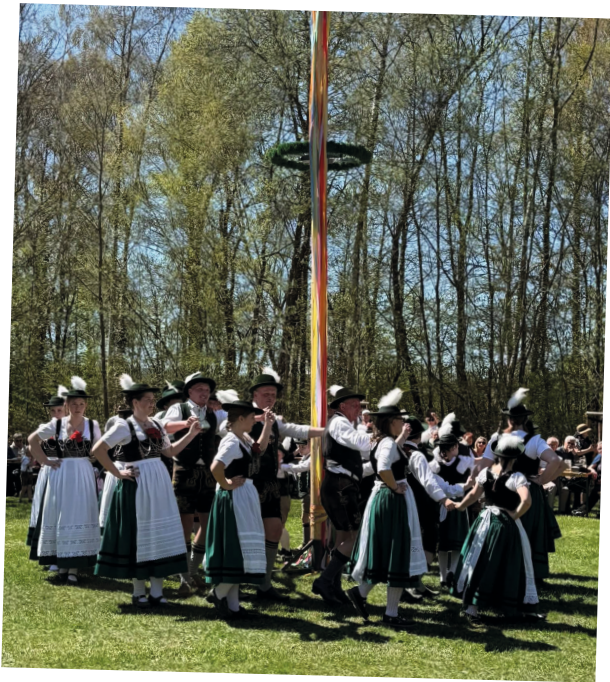
Der traditionelle Bändertanz des Trachtenvereins Almrausch sorgte bei Kaiserwetter für einen herrlichen Start in die Sommersaison.

Sein Fazit – und zugleich ein Leitgedanke des diesjährigen 1. Mai: Solidarität muss heute global gedacht werden. Es geht nicht nur um gute Arbeitsbedingungen vor Ort, sondern auch um soziale Gerechtigkeit, Bildungschancen und menschenwürdige Lebensverhältnisse weltweit. Der Nachmittag stand ganz im Zeichen gelebter Tradition. Die Mitglieder des Trachtenvereins Almrausch und sämtliche Engagierte sorgten im Kurpark wieder für eines der schönsten Maibaumfeste in der Region.