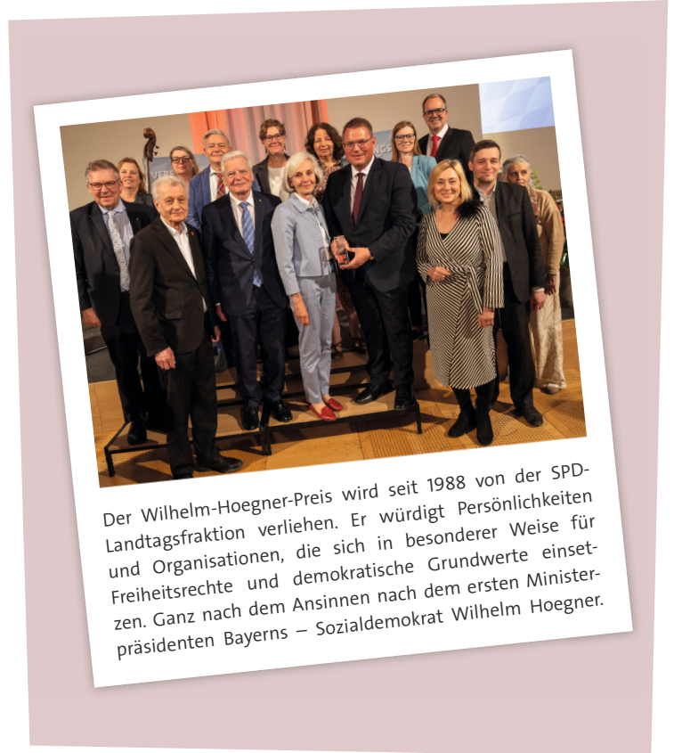
Der Wilhelm-Hoegner-Preis wird seit 1988 von der SPD-Landtagsfraktion verliehen. Er würdigt Persönlichkeiten und Organisationen, die sich in besonderer Weise für Freiheitsrechte und demokratische Grundwerte einsetzen. Ganz nach dem Ansinnen nach dem ersten Ministerpräsidenten Bayerns – Sozialdemokrat Wilhelm Hoegner.